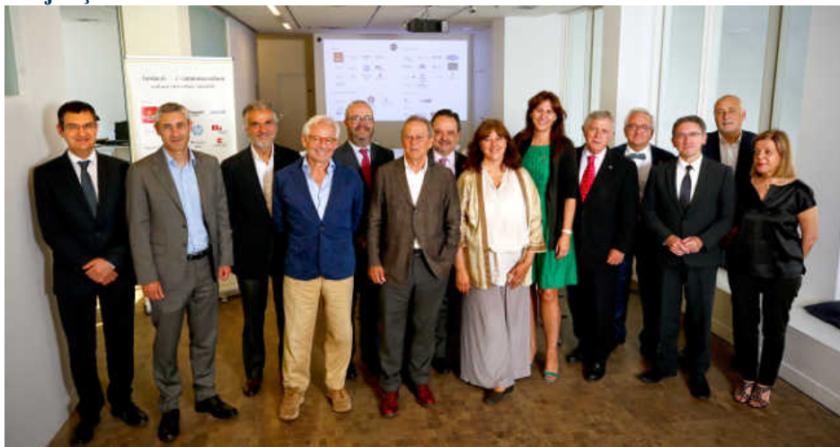
Laura Borràs Patronat Catalunya Cultura

El Patronat de la Fundació Catalunya Cultura, l'organisme de govern de la Fundació, reunit en sessió ordinària, proposà a la Consellera de Cultura Laura Borràs, reprendre l'agenda per impulsar un nou marc legal pel mecenatge i fer de la cultura una aposta estratègica compartida. Aposta també per donar un nou impuls en matèria legislativa a Catalunya, coincidint amb la presència de la Consellera de Cultura a la reunió. El moment actual, de major estabilitat institucional, és una oportunitat per reprendre el full de ruta fixat fa temps amb l'objectiu d'ampliar i millorar les iniciatives de mecenatge a Catalunya.