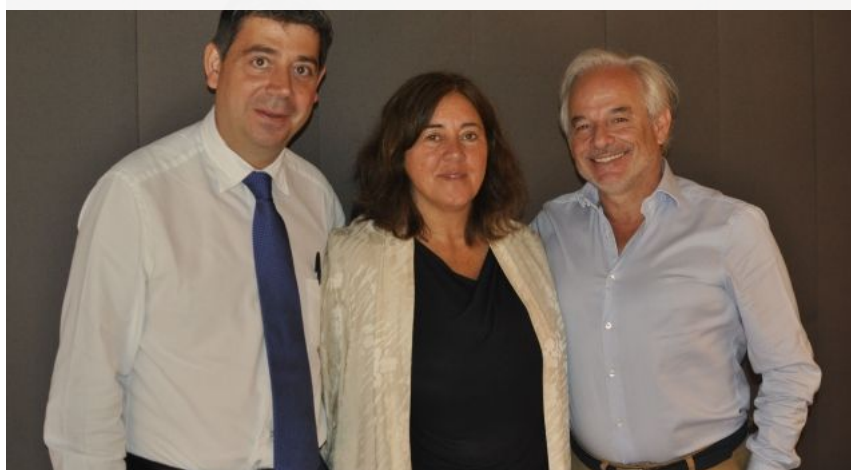
Representants de la Fundació Catalunya Cultura

La Fundació Catalunya Cultura es va crear l'any 2015 amb l'objectiu de posar en contacte les empreses amb el món de la cultura per impulsar col·laboracions que facin realitat projectes culturals d'interès general. Des de llavors, l'entitat ha acompanyat un total de 141 projectes a través de La Llotja, una eina " per ajudar els projectes a trobar finançament ", en paraules d' Eloi Planes , president de Fluidra i vicepresident de la Fundació. Fruit d'aquesta experiència, la fundació ha detectat la necessitat d'oferir una formació personalitzada que ajudi a enfortir les capacitats de cada projecte.