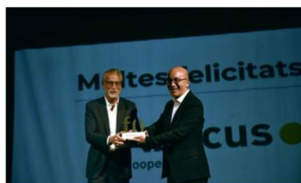
Direcció Soler, conseller delegat d'Abacus rep el Premi Empresa Cultura 2022 | ALN

Redacció VIA Empresa Barcelona, 21 d'octubre de 2022 11:34