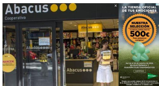
Una botiga d'Abacus al barri de Sant Andreu.